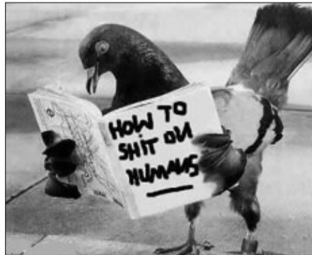
Για όσους δεν ξέρουν αγγλικά: Πώς να κοιτουλάτε τους ανθρώπους.

✚ «Κύμα» φυσικά, όχι «τσουνάμι»... Δε βρήκαμε και μεις καινούρια λέξη, να την κάνουμε πασπαρτού!