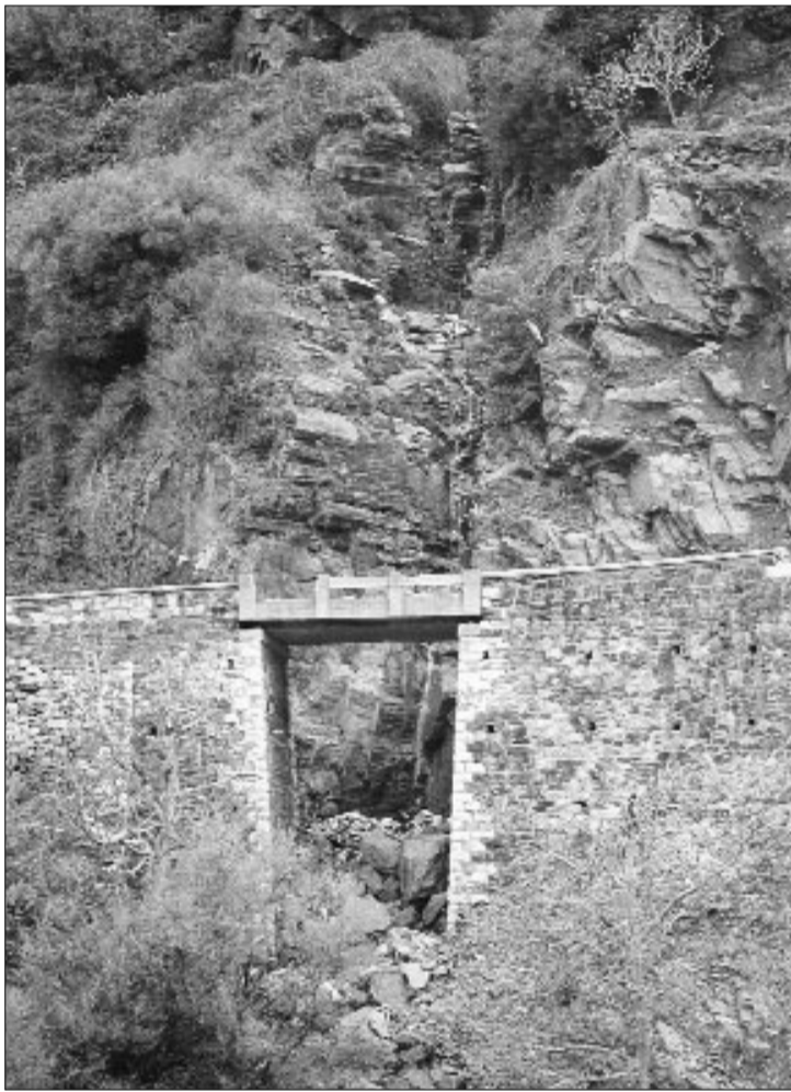
Καλό και θεάρεστο να συμπαραστεχόμαστε στα θύματα της ΝΑ Ασίας, αλλά να μην ξεχνάμε και τις δικές μας καταστροφές, που προκλήθηκαν από τη θεομηνία του 2001 και ακόμα δεν έχουν αποκατασταθεί.

‘Ότο ώρα 5.10 πρωινή της 9 Ιουλίου 1956 και ακούστηκε πρώτον μία υπόκωφος βοή που δεν πρόλαβε άνθρωπος να καταλάβει πότε προέρχεται διότι συνοδεύετο ταυτοχρόνως με μια σεισμική δόνηση που στα 59