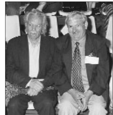
Με τον Μανώλη Γλέζο, συμπρωτεύη, αγωνιστή και πρώτο Πατριζάνο της Ευρώπης.