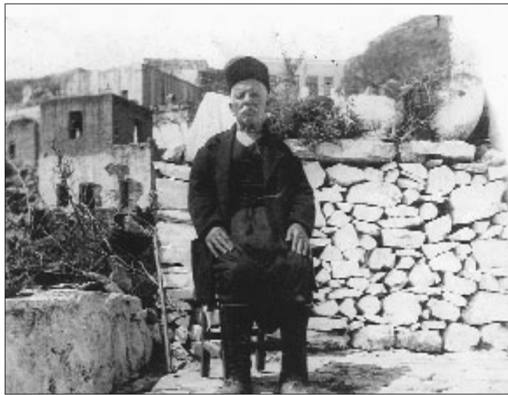
Ο Έρο Παρεντροέργης...