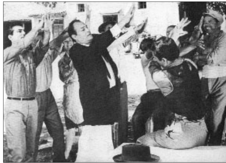
Ας τα ριξουμε κι εμουνού του «Καποδίστρια» να μην ντου τα χρωστούμενε...

Πότε θα μάθουμε πού, πώς και με ποια κριτήρια παίρνονται οι