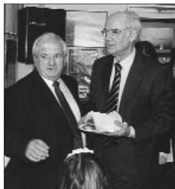
Με τον πρώην Πρόεδρο της Βουλής Απόστολο Κακλαμάνη σε εκδήλωση κοπής πίτας του Συλλόγου Απολλωνιατών.

Ο τόπος μας είχε κι έχει ανάγκη από περισσότερες «μονάδες» εμπροσθοφυλακής. Σε ένα «στράτευμα» που οφείλει να είναι αξιόμαχο και αποτελεσματικό η κατανομή των «μάχιμων» σε