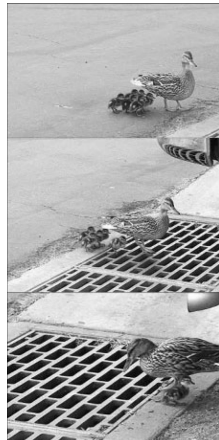
Η σωστή καθοδήγηση φέρνει τους νέους στο Σύλλογο.