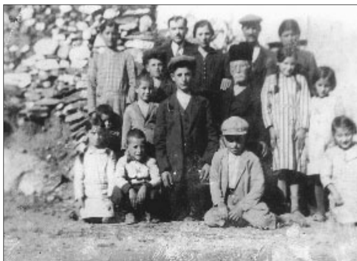
...και η φαμελιά του.