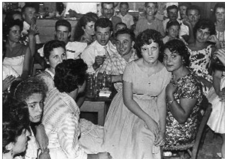
Από γλέντι της Θεοσκέπαστης σ' ένα καφενείο του χωριού.

Ας αναφέρω τώρα και τα καφενεία που ήταν πιο απόμερα. Πάρα πάνω από του Ματζάκου υπήρχε το μαγαζί του Μπογιατζηδοκοσταντή , γιου του Βασίλη Παντελιά, που εγώ δεν το «έ-