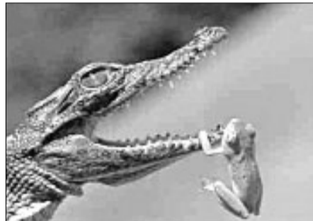
Συνηθισμένη εικόνα για όσους γνωρίζουν την πανίδα που ευδοκίμει στο Φράγμα της Φανερωμένης.

✚ Κυρίες, κύριοι, αφού εγκαταλείψετε κάθε προσπάθεια να σβήσετε τα παρακάτω, διαβάστε! ✚ Άλλαξε ο χρόνος(;), κόψαμε την πίτα, πήραμε κιλά, ανταλλάξαμε (ψ)ευχές, μυαλό όμως, δε βάζουμε ποτέ! Για μας, πάντα, πρέεεερα βρέεεεει! ✚ Τελικά το παλιό ημερολόγιο επικράτησε... Οι μισοί σχεδόν ερωτηθέντες στα ρεπορτάζ αγορών των γιορτών είπαν πως την ημέρα των Χριστουγέννων έφαγαν όπως κάθε μέρα και όταν έπεσαν οι τιμές, πήραν τη γαλοπούλα.