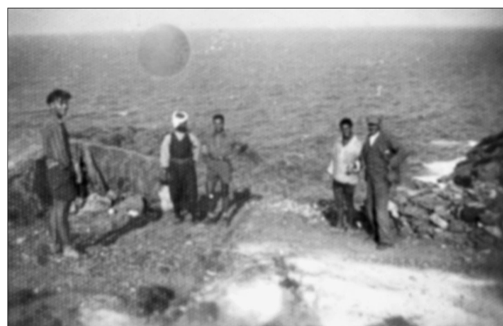
Φωτογραφία από το παρατηρητήριο των Ιταλών στο Σταυρή την Κατοχή, που περιλαμβάνεται στη νέα έκδοση.