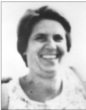
Είναι μια λάμψη ο άνθρωπος κι αν είδες, είδες...