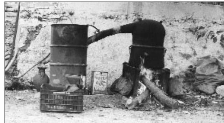
Από του Αγίου Δημητρίου και μετά άρχιζαν τα ρακιντζά...

Με τις πρώτες βροχές οι γεωργοί ετοίμαζαν τα χωράφια για τη σπορά. Έσπερναν γέννημα (σιτάρι) για το ψωμί της φαρμακίας τους. Από του Αγίου Δημητρίου και μετά άρχιζαν τα ρακιντζά, που κρατούσαν και μέχρι τις αρχές του Δεκεμβρη. Στην σημερινή εποχή ρακιντζίζουν μόνο την ημέρα, ενώ άλλοτε τη δουλειά αυτή γίνονταν μέρα-νύχτα.