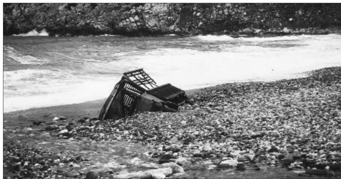
...όχι μόνο αναπτυξιακά έργα δεν προωθούνται... αλλά έχουμε επί πλέον και καταστροφές.