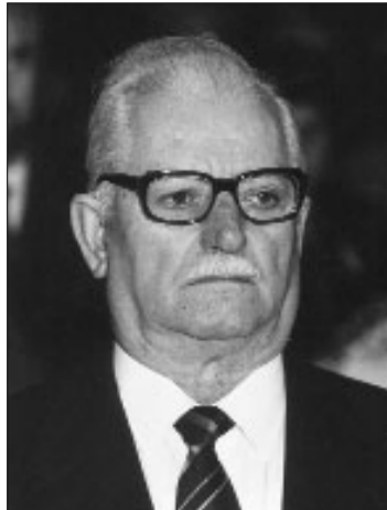
Ας μη μου δώσει η μοίρα μου σε ξένη γης τον τάφο... Είναι γλυκός ο θάνατος μόνον όταν κοιωόμεθα εις την Πατρίδα.