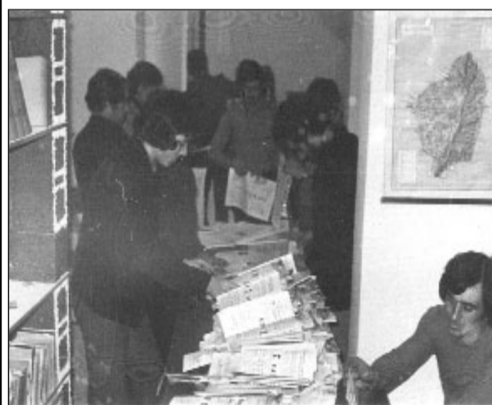
Σκηνή από το δίπλωμα της εφημερίδας που γινόταν παλιά στη λέσχη του Συλλόγου. Συλλογική και ομαδική δουλειά που εξελισσόταν σε πραγματικό πανηγύρι. Τα καλαμπούρια έδιναν κι έπαιρναν. Εκεί γινόταν η κριτική και τα σχόλια. Εκεί γινόταν η ανάλυση σε βάθος του Ιάnnη και του Έργη. Ιδιαίτερα σχολιάζονταν και επικρίνονταν οι... λουφαδάροι, που απέφνευαν συστηματικά την κομιαστική αυτή δουλειά... όπως ο γάδαρος τ' αλώνι.