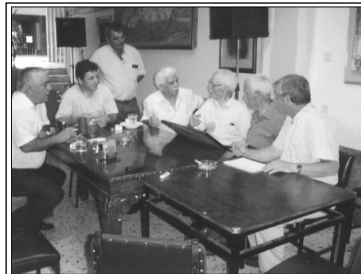
Στιγμιότυπο από την κουβέντα με τους συνομηλίκους του Συλλόγου. (Λεπτομέρεια στη σελ. 5.)