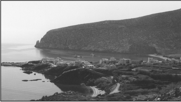
Ανάπτυξη και προστασία του περιβάλλοντος πρέπει και μπορούν να συνυπάρχουν.