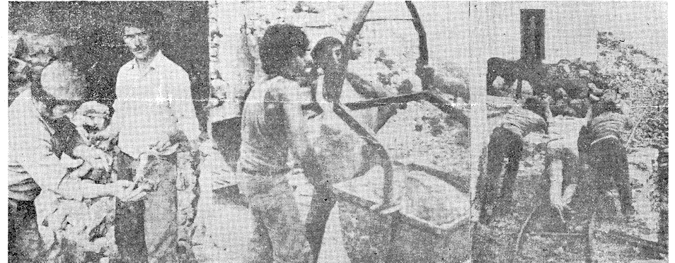
Άπό το φωτογραφικό ρεπορτάζ της ΕΛΕΥΘΕΡΟΥΠΙΑΣ για τα άρχισια της Νάξου.