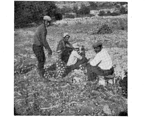
λίγο πριν το ... πέταμα