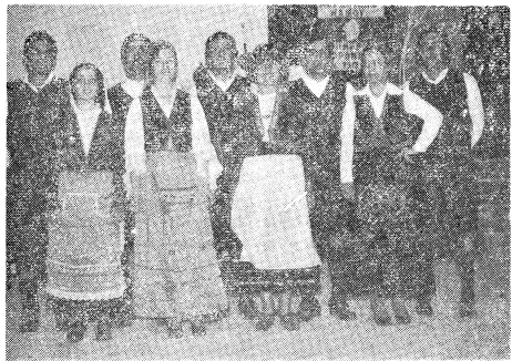
Το χορευτικό του Συλλόγου Κορωνίδας Νάξου με τις παραδοσιακές φορεσιές.

Εκτιμώντας σωστά το Δ.Σ. της Ο.Ν.Α.Σ. αποφάσισε τη δημιουργία επιτροπής που θα ετοιμάσει αμέσως το 5ο Πανναξιακό Φεστιβάλ και καλεί όλους όσους θέλουν να την πλαισιώσουν για την καλύτερη πραγματοποίηση του.