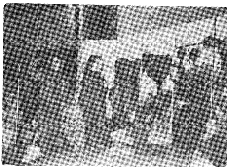
Στιγμιότυπο άπό τό 4ο Πανναξιακό Φεστιβάλ, με τό Παϊδικό Θέατρο τού Μορφωτικού Συλλόγου Γκάζη.

(μία που μετά τίς έκλογές τού 1977 άντικαταστάθηκε ο κ. Καλατζίκος άπό τό Υπουργείο Συντονισμού) προσπάθησαν να τό αλλάξουν, και να άναλάβουν τή κυριότητα έργα της Νάξου για τό 1979 - 80. Νόμιμα έπί έτσι θα ίκανοποιηθούν, βλάνοντας τό πρόγραμμα. Όμως είναι φανερό ότι ή άναδομή τών έργων για τό 1981 - 82 έχει σαν συνέπεια να είναι πολύ ή άδεία ή πραγματοποίησή του, άφο τό 1981 ή τετραετία