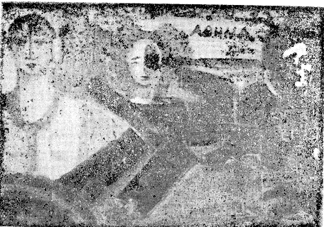
Έργο του Νικόλα Μπάκαλου που πήξε το 2ο Βραβείο ζωγραφικής σε Πανταλική Έκθεση το 1975 με θέμα το Πολυτεχνείο

Άς πάρουμε σα παράδειγμα τους οικισμούς, τις οικοδομές. Μπορούν νομίζω οι καλλιτέχνες — άς θεωρήσουμε στο θέμα αυτό καλλιτέχνες, όπως άλλωστε πρέπει και να είναι και τους αρχιτέκτονες — να μελετήσουν, να σχεδιάσουν την παραδοσιακή οικοδομή του τόπου και σε συνέχεια τις δυνατότητες προσαρμογής σ' αυτήν και των σύγχρονων κατα-