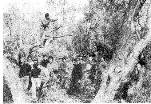
ΕΞΟΡΜΗΣΗ ΓΙΑ ΚΛΑΔΕΜΑ ΤΟΥ Α.Σ.Σ.Ν. ΣΤΟ ΣΑΓΚΡΙ

Δ Ρ Ο Μ Ο Σ Σ Α Γ Κ Ρ Ι Ο Υ - Τ Ρ Ι Π Ο Δ Ι Ω Ν : Ο έρμος Σαγκριού - Τριπόδων (2850 μ.) είναι ο κεντρικότερος βόρμος που συνδέει την πεδινή με κεντρική και όρινη Νάεο. Μέσω αυτού γίνεται κάθε έμπορικη, αγροτική και τουριστική κίνηση. Παρ' όλα αυτά είναι σχεδόν αδιάβατος. Τελευταία που ο έρμος Σαγκριού - Γαλαξιδίου είχε κλείσει για μεγάλο χρονικό διάστημα, κάθε διακίνηση γίνεται αποκλειστικά από τον δρόμο Σαγκριού - Τριπόδων. Η οικητική κατάσταση που βρίσκεται, είχε ως συνέπεια να κολλήσουν κυριολεκτικά