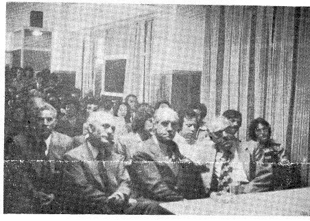
Στην άπό το τα έγκαίνια της Λέσχης του Συλλόγου Σκαδιωτών - Νάξου.

άπό τα χαμηλότερα στην Ευρώπη. Σ' όλη την Ελλάδα άνα το 48% πάει άπό το Δημοτικό στο Γυμνάσιο, ενώ στο νομό Κυκλάδων το ποσοστό περιορίζεται στο 33%. Τό χωριό Καλιάνι της Κορωνιδίας με 170 κατοίκους έχει γυμνασιόμ, ενώ τ ά χ ω ρ ι ό Κ ό ρ ω ν ο ς, Κ ω μ ι α κ ή, Σ κ α δ ό, Μ έ σ ο κ α τ ο ι κ ο υ ς δ έ ν έ χ ο υ ν. Στο Σκαδό τα παιδιά για άυτερο χρόνο κάνουν μάθημα σ' ένα μικρό και άνοθυγεινό καφεενείο που πού πολύ θυμίζει κρηφό σχολείο της Τουρκίας παρά Δημοσίου Έκπαιδευτικότητας.