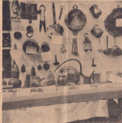
Μερικά από τα έθνη λαϊκής τέχνης που έκτέθηκαν στο Α' Πανναξιακό Φεστιβάλ.