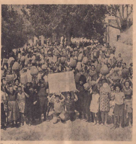
Ένα άλλο χωριό χωρίς διαφά και φέτος. Και το Καματερό στην Άθλια και η θεοταλαστική άδωμα και άλλα μέρη της Ελλάδας μερίζονται από τη διαφά. Άλλα η κατάσταση των Φιλωτιτών είναι περισσότερο τραγική. Οι δούλοι και φέτος στους δρόμους με άδεια λαϊνά για να διαπρανάσουν τα στενά στομάτια το δικό τους. Για να αποδοθούν οι αγώνες άπέναντος. Θα δροθεί κανείς άρμόδιος να τους άκοιστεί.