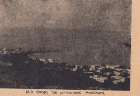
Μιά άποψη του μη γευτικού 'Απόλλωνα.