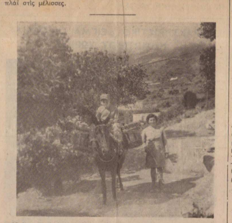
Ο έρχομός άπό τα χτήματα με ζώο φορτωμένο.