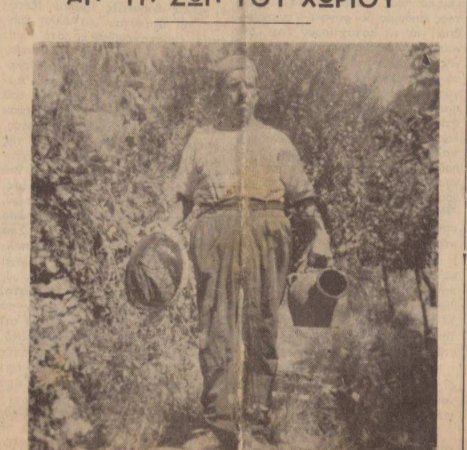
Έποχή μαζέματος του μελιού. Ο μελισσοκόμος με τα εργαλεία του πλάι στις μελισσες.