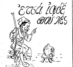
Έστρά' ιαδ'ε σου' λες