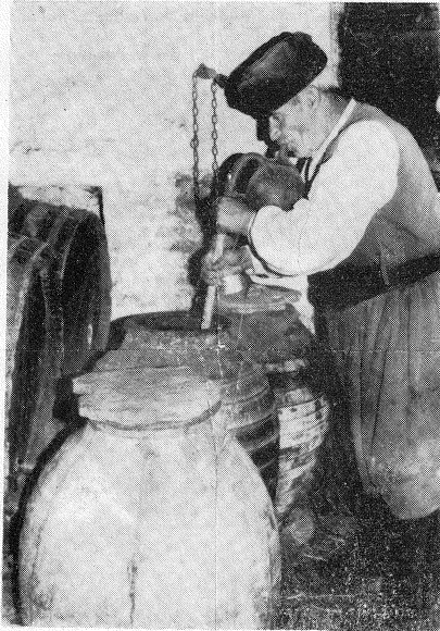
Ὁ γέρο θρακῃς θῃγῃζει κρεσῃ ἀπ' τὸ πιθῃρι μὲ τὸ σφουνοκῃλαμο.