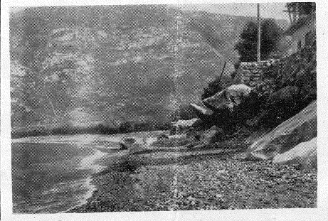
μα, τὰ κήματα δὲ χυποσῶσαν κυριολογικῶς στά βράχια.

της Νομαρχίας. «Βίς άρθρον της 'Κορωνιδος δημοσιευθεν την 15-9-1972 περί προσχώσεων εἰς τὸν θρῖον τὸν 'Απόλλωνος ο Νομάρχης Κυκλάδων κ. Δ. Κωστοκόπουλος μῆς άπέστειλεν έγγραφον εἰς τὸν οποίον μεταξύ άλλων αναφέρει: έν τὸν μέχρι τούδε ένδειξουν δέν δύνανται να κρηθῆ βάσιμος η δι-