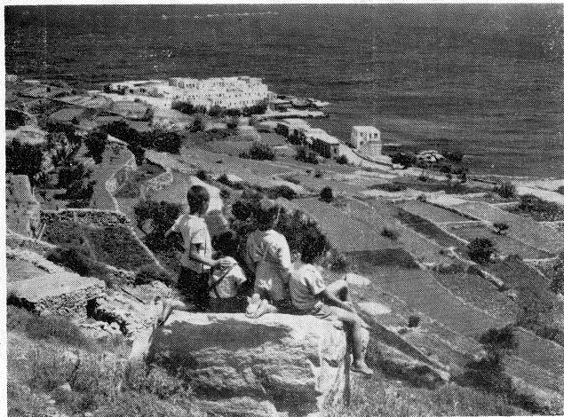
Τὴ νὰ κοιτοῦν ἄραγε τὰ παιδιὰ τῆς φωτογραφίας; Μάλλον τὸ μέλλον. Τὸ βλέπουν μακριὰ, πέρα ἀπὸ τὸν τόπο τους, πέρα ἀπὸ τὴν θάλασσα. Ὁ τόπος τους δὲν τοὺς παρέχει ἐφόδια γιὰ ἕνα σύγυρο μέλλον.